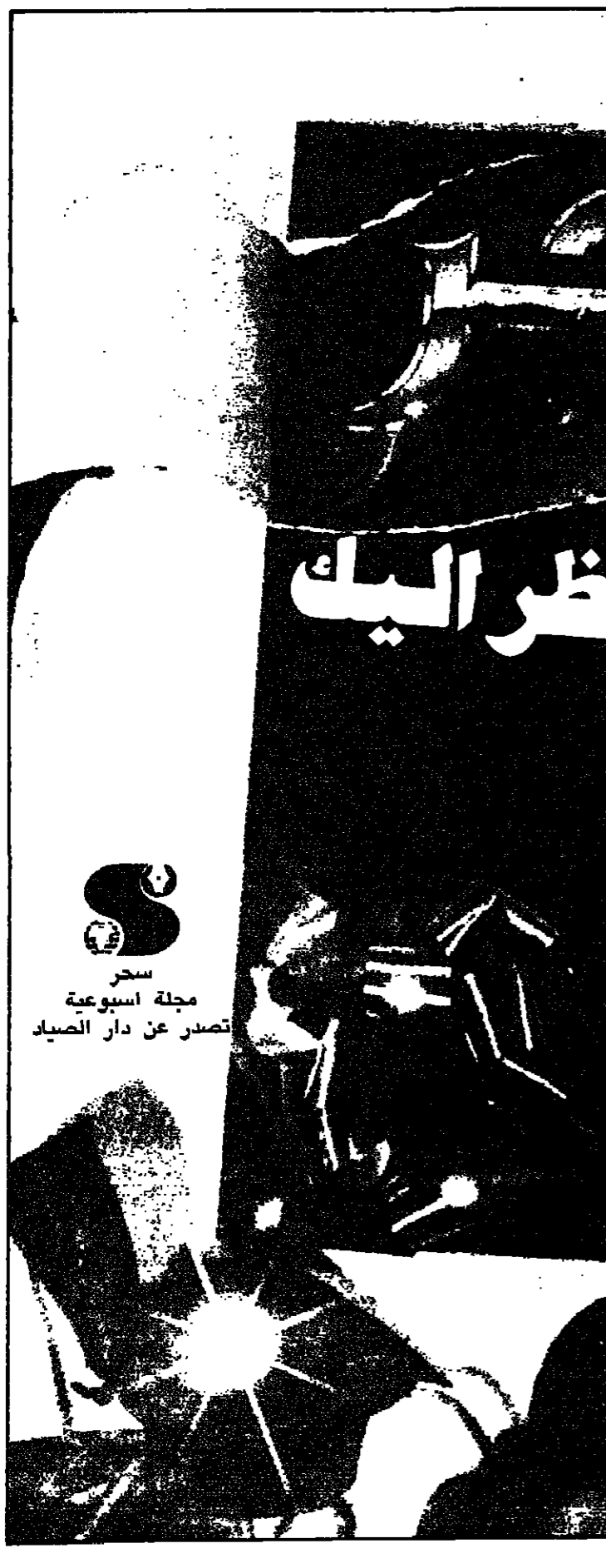
سحر مجلة اسبوعية تصدر عن دار الصيد